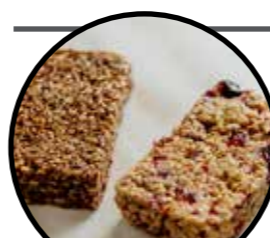
21. ΜΠΑΡΕΣ ΔΗΜΗΤΡΙΑΚΩΝ σοκολάτα ΚΩΔ.ΠΡ. 585-92 κράνμπερι ΚΩΔ.ΠΡ. 585-93 ΒΑΡΟΣ 55g ΤΙΜΗ 1.20€ τεμ.