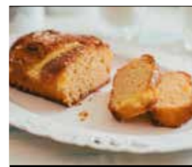
17. ΛΕΜΟΝΙ ΚΩΔ. ΠΡ. 894-3 ΒΑΡΟΣ 300g ΤΙΜΗ 2.70€