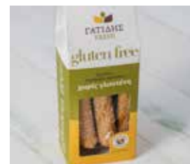
24. ΚΡΙΤΣΙΝΙΑ ΜΕ ΣΟΥΣΑΜΙ ΚΩΔ. ΠΡ. 585-9 ΒΑΡΟΣ 170g ΤΙΜΗ 2.40€