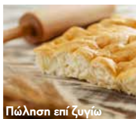
06. ΨΩΜΙ ΦΟΚΑΤΣΙΑ ΜΕ ΕΛΑΙΟΛΑΔΟ ΚΩΔ. ΠΡ. 499-8 ΒΑΡΟΣ 1kg ΤΙΜΗ 10.00 /κιλό €