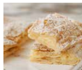
10. ΧΕΙΡΟΠΟΙΗΤΗ ΚΡΕΜΟΠΙΤΑ ΚΩΔ. ΠΡ. 499-84 ΒΑΡΟΣ 380-420g ΤΙΜΗ 6.30€