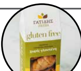
29. ΚΟΥΛΟΥΡΑΚΙΑ ΚΑΝΕΛΑ ΑΜΥΓΔΑΛΟ ΚΩΔ. ΠΡ. 585-7 ΒΑΡΟΣ 170g ΤΙΜΗ 2.80€