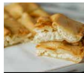
07. ΧΕΙΡΟΠΟΙΗΤΗ ΤΥΡΟΠΙΤΑ ΚΩΔ. ΠΡ. 499-81 ΒΑΡΟΣ 450 - 500g ΤΙΜΗ 7.30€