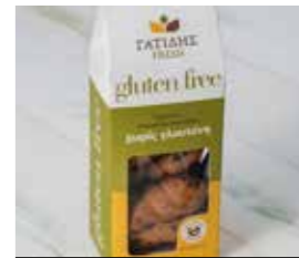
26. ΚΟΥΛΟΥΡΑΚΙΑ ΚΑΚΑΟ ΣΤΑΓΟΝΙΔΙΑ ΚΩΔ. ΠΡ. 585-8 ΒΑΡΟΣ 170g ΤΙΜΗ 2.80€