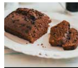
15. ΕΠΙΚΑΛΥΨΗ ΣΟΚΟΛΑΤΑΣ ΚΩΔ. ΠΡ. 894-8 ΒΑΡΟΣ 350g ΤΙΜΗ 4.80€