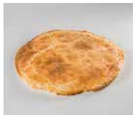
05. ΑΡΑΒΙΚΗ ΠΙΤΑ ΚΩΔ. ΠΡ. 499-4 ΒΑΡΟΣ 180g ΤΙΜΗ 1.15€