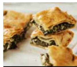
08. ΧΕΙΡΟΠΟΙΗΤΗ ΣΠΑΝΑΚΟΤΥΡΟΠΙΤΑ ΚΩΔ. ΠΡ. 499-82 ΒΑΡΟΣ 480 - 530g ΤΙΜΗ 6.90€