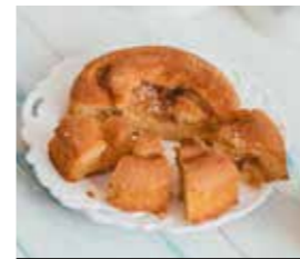
18. ΜΗΛΟ ΚΩΔ. ΠΡ. 894-5 ΒΑΡΟΣ 220g ΤΙΜΗ 2.00€