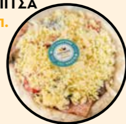
ΓΑΛΟΠΟΥΛΑ-ΚΑΣΕΡΙ ΚΩΔ. ΠΡ. 587