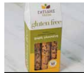
23. ΚΡΙΤΣΙΝΙΑ ΜΕ ΛΙΝΑΡΙ ΚΩΔ. ΠΡ. 585-91 ΒΑΡΟΣ 170g ΤΙΜΗ 2.40€