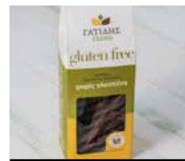
22. ΚΟΥΚΙΣ ΣΟΚΟΛΑΤΑ-ΚΑΚΑΟ ΚΩΔ. ΠΡ. 585-4 ΒΑΡΟΣ 190-210g ΤΙΜΗ 2.30€