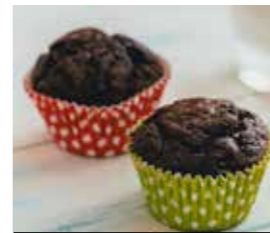
20. ΜΑΦΙΝ ΜΕ ΒΑΤΟΜΟΥΡΟ ΚΩΔ. ΠΡ. 894-6 ΒΑΡΟΣ 2 ΤΕΜ. 80g ΤΙΜΗ 2.40€