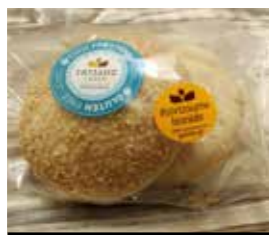
02. ΨΩΜΑΚΙΑ ΜΠΕΡΓΚΕΡ ΚΩΔ. ΠΡ. 499-731 ΒΑΡΟΣ 2x75g ΤΙΜΗ 0.70€