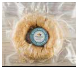
03. ΚΟΥΛΟΥΡΙ ΣΟΥΣΑΜΙ ΚΩΔ. ΠΡ. 499-71 ΒΑΡΟΣ 2x80g ΤΙΜΗ 1.00€