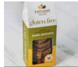
27. ΚΟΥΛΟΥΡΑΚΙΑ ΤΡΙΓΩΝΑ ΜΕ ΣΟΚΟΛΑΤΑ ΚΩΔ. ΠΡ. 585-3 ΒΑΡΟΣ 200-220g ΤΙΜΗ 2.40€