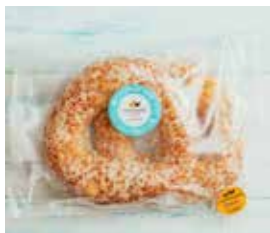
04. ΚΟΥΛΟΥΡΙ ΚΕΦΑΛΟΤΥΡΙ ΚΩΔ. ΠΡ. 499-74 ΒΑΡΟΣ 2x80g ΤΙΜΗ 1.40€