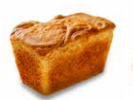
13. ΨΩΜΙ ΚΩΔ. ΠΡ. 499 ΒΑΡΟΣ 420g ΤΙΜΗ 2.00€

Διασφάλιση ποιότητας τροφίμων με πιστοποίηση ISO 22000:2005 και FSSC 22000:2010