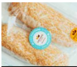
01. ΜΠΑΓΚΕΤΑΚΙΑ ΚΩΔ. ΠΡ. 499-73 ΒΑΡΟΣ 2x75g ΤΙΜΗ 0.70€