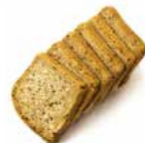
14. ΠΟΛΥΣΠΟΡΟ ΣΕ ΦΕΤΕΣ ΚΩΔ. ΠΡ. 499-6 ΒΑΡΟΣ 240-260g ΤΙΜΗ 2.40€