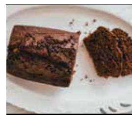
16. ΣΟΚΟΛΑΤΑ ΚΑΚΑΟ ΚΩΔ. ΠΡ. 894-1 ΒΑΡΟΣ 300g ΤΙΜΗ 2.70€