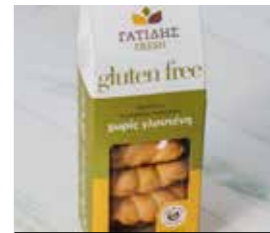
25. ΚΟΥΛΟΥΡΑΚΙΑ ΠΛΕΞΙΔΑ ΚΩΔ. ΠΡ. 585-12 ΒΑΡΟΣ 170g ΤΙΜΗ 2.80€