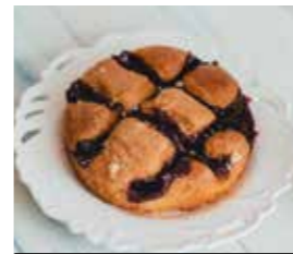
19. ΒΑΤΟΜΟΥΡΟ ΚΩΔ. ΠΡ. 894-2 ΒΑΡΟΣ 220g ΤΙΜΗ 2.00€